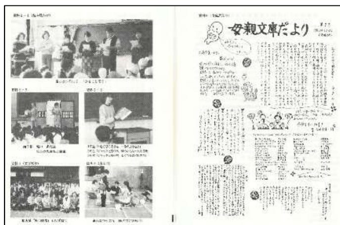
平成9年度PTA母親文庫運営協議会 総会・運営研究会並びに講演会資料から