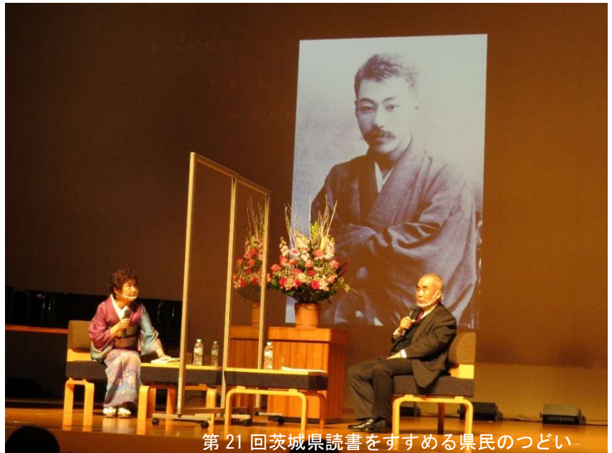
第21回茨城県読書をすすめる県民のつどい

【お問い合わせ先】 茨城県立図書館 〒310-0011 茨城県水戸市三の丸1-5-38 普及課 TEL 029-228-3622 FAX029-228-3583