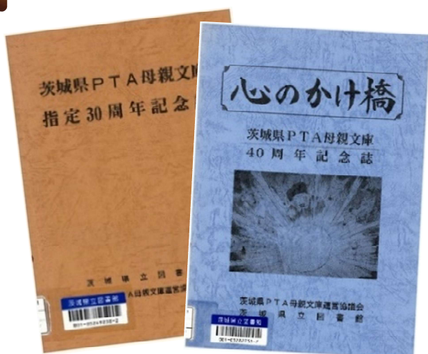
PTA 母親文庫 30 周年記念誌・40 周年記念誌