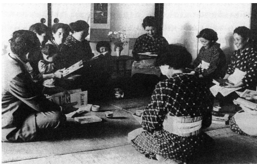
昭和30年代の様子（PTA母親文庫30周年記念誌より再掲）