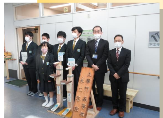
つくば特別支援学校長（右）・生徒達