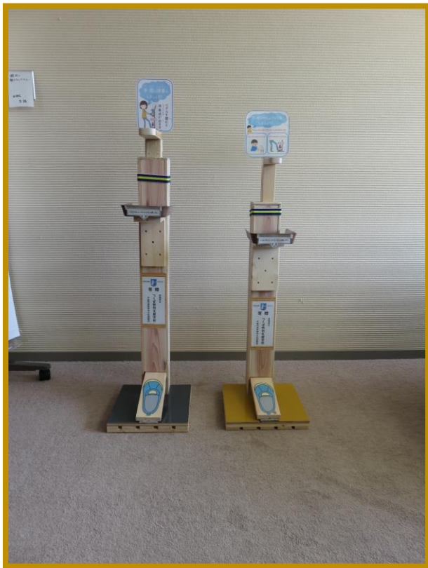
足踏み式ポンプスタンド・大人用・子供用